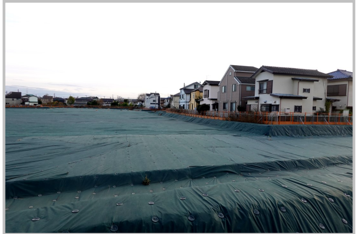
旧ひばりが丘中学校跡地

旧ひばりが丘中学校跡地は、令和16年以降に学校用地として使用することになりますが、それまでは暫定活用するとの教育長答弁がありました。