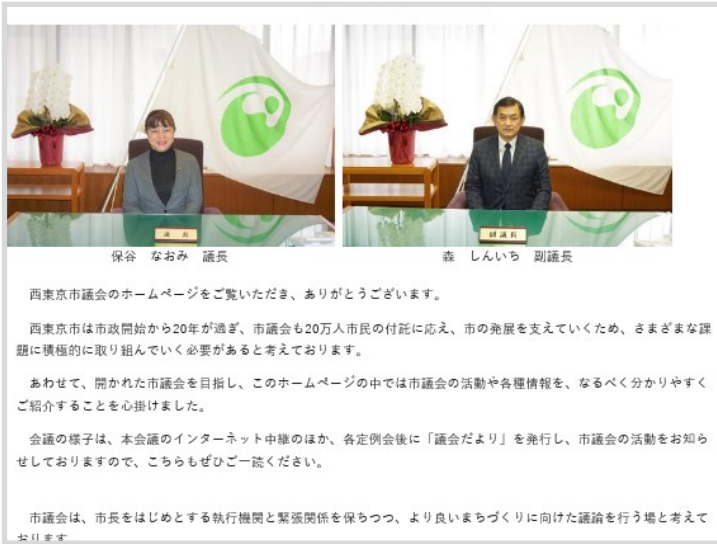
正副議長のページ

キッズページでは、「いこいな」が市議会をご紹介します。議会便りのバックナンバーも見やすくなりました。ぜひご覧ください。